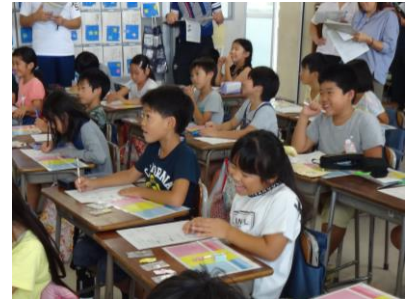
【学習は楽しく真剣に】

1学期が終わると5日間の秋休みに入ります。1学期の成果と課題を振り返り、2学期の目標を定める大切な時期です。御家庭でも通信票を一つの材料としながら話し合い、お子様が目標を持って2学期の学校生活を送ることができるようお声掛けをお願いいたします。